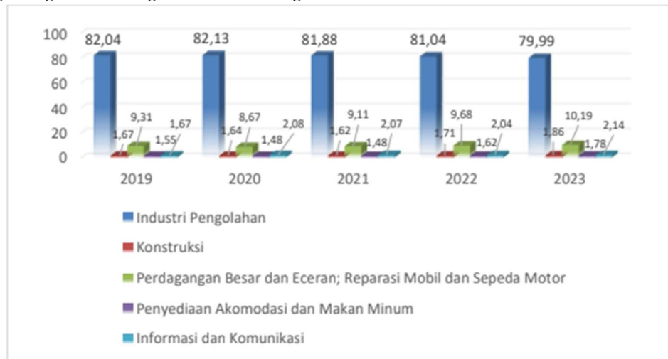
Gambar 2 Distribusi Presentase Produk Domestik Regional Bruto Kota Kediri Menurut Lapangan Usaha (persen), 2019-2023

Kota Kediri menjadikan sektor industri pengolahan sebagai sektor dominan. Pertumbuhan sektor industri di suatu wilayah dapat diukur melalui besaran kontribusi terhadap Produk Domestik Regional Bruto daerah. Di Kota Kediri, kontribusi dari sektor industri selalu menduduki peringkat tertinggi dengan selisih signifikan dibandingkan sektor-sektor ekonomi lain